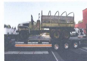
Lycée professionnel de Grande-Synthe (Nord) - Le GMC lors de son arrivée, et en cours de rénovation aujourd'hui.